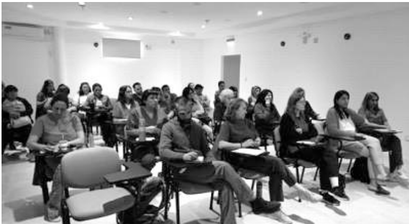
Foto: Participación de los referentes de equipos técnicos Zoonosis Municipalidad Trelew y Rawson y Veterinaria, Msal Chubut, en sede Colegio Médico Veterinario Chubut en la localidad de Trelew.

Nota: Actividad Replicada en Puerto Madryn (Hospital Isola) y en Comodoro Rivadavia (Universidad Nacional de la Patagonia San Juan Bosco).