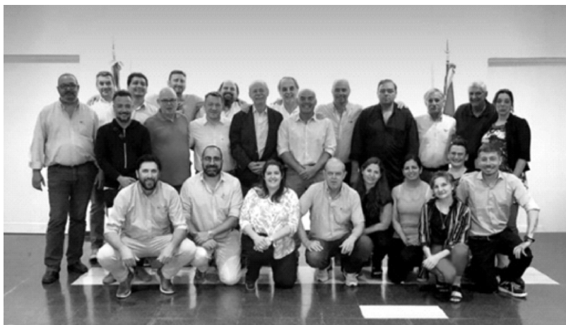
PRESIDENTES Y REPRESENTANTES DE COLEGIOS Y CONSEJOS VETERINARIOS Y CD DE LA FEVA