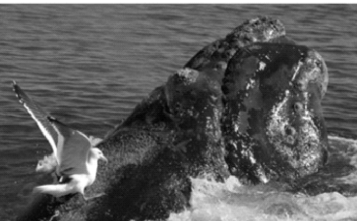
Ataque de gaviotas a ballena franca austral

2.4.-En el área de Península Valdés, vital para el ciclo reproductivo, (apareamiento y nacimientos) de la ballena franca austral ( Eubalaena australis ), las gaviotas han aprendido a alimentarse de la piel y la grasa de las ballenas, posándose sobre el lomo y picoteando, lo que produce dolor y altera el comportamiento normal de las ballenas. La mayoría de las gaviotas que atacan son adultas (80%), pero también lo hacen individuos juveniles (20%), lo que indica que las gaviotas aprenden este comportamiento tempranamente por imitación, extendiéndose este hábito alimentario entre la población (Lisnizer et al., 2011).