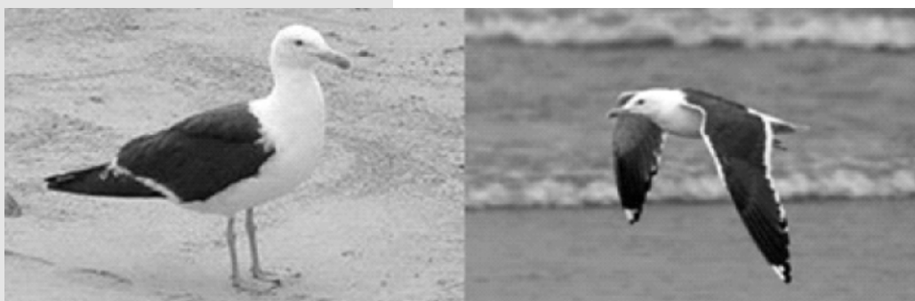
gaviota cocinera ( Larus dominicanus )

Por otra parte, son extremadamente inteligentes ya que poseen un sistema complejo de comunicación y una estructuración social, con referencia al resto de aves, muy desarrollada.