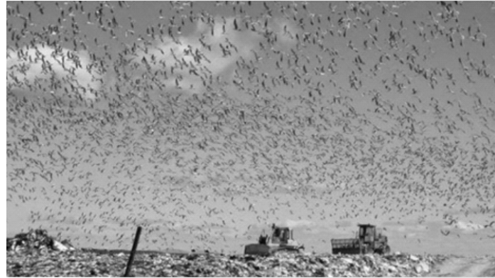
Sobre población producto de basureros a cielo abierto