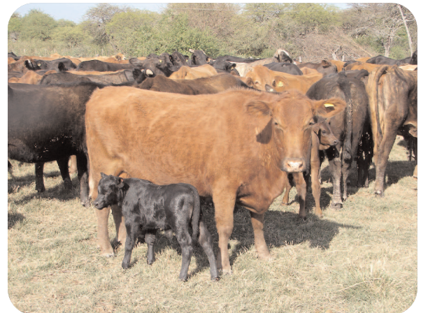
Figura 4. Por su actividad contra las larvas de primer estadio la doramectina protege las heridas susceptibles (por ejemplo umbilicales) por 10 a 12 días. Sin embargo, su actividad es reducida en heridas ya infestadas con larvas de segundo y tercer estadio