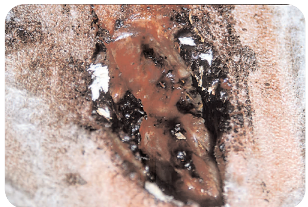
Figura 2. Herida accidental en un ternero con masas de huevos (queresas) en sus bordes