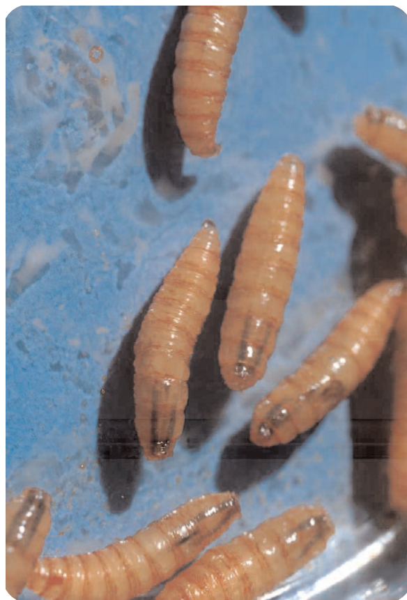
Figura 3. Larvas maduras de Cochliomyia hominivorax de siete días de edad y próximas a pupar.

Las infestaciones múltiples pueden llegar a ocasionar mutilaciones y la muerte de los animales masivamente parasitados, especialmente de terneros. La muerte generalmente es el resultado de infecciones secundarias y fenómenos de autotoxicidad. Existen antecedentes, en áreas donde este insecto es enzoótico durante todo el año como por ejemplo Chaco y Formosa, que en el pasado cercano, las miasis umbilicales por larvas de C. hominivorax fueron responsables de la mortalidad del 10 al 15 % de los terneros nacidos anualmente en estas provincias. Así mismo, a pesar del tratamiento específico temprano que evita la mortalidad, las miasis también pueden tener un alto impacto negativo productivo directo.