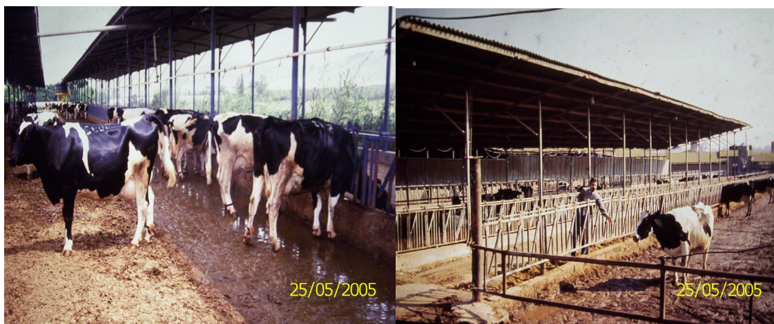
Foto 5 y 6: Imágenes de media sombra y tinglados (descanso) en tambos de Israel

En la misma línea, el Dr. Flamenbaum comentó que en Israel el principal método empleado se basa en el incremento de la evaporación desde la superficie corporal. Para ello se aplica en forma combinada y simultánea: sombra (grandes tinglados abiertos en los laterales), duchas (aspersores) y ventilación forzada en la sala de pre-ordeño y los corrales de reposo (lugares abiertos) (Fotos 5 y 6).