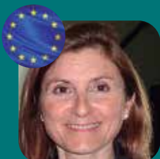
AGUT GIMENEZ IMAGENOLOGÍA