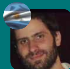
DONATI ENFERMEDADES RESPIRATORIAS