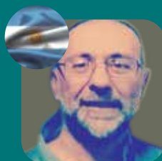
MANGIERI TEJIDOS BLANDOS