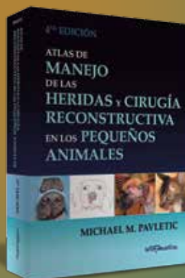
Atlas de manejo de las heridas y cirugía reconstructiva en los pequeños animales Pavletic