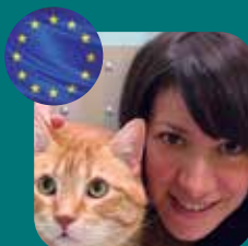
DESSAL MEDICINA FELINA/ NEUROLOGÍA