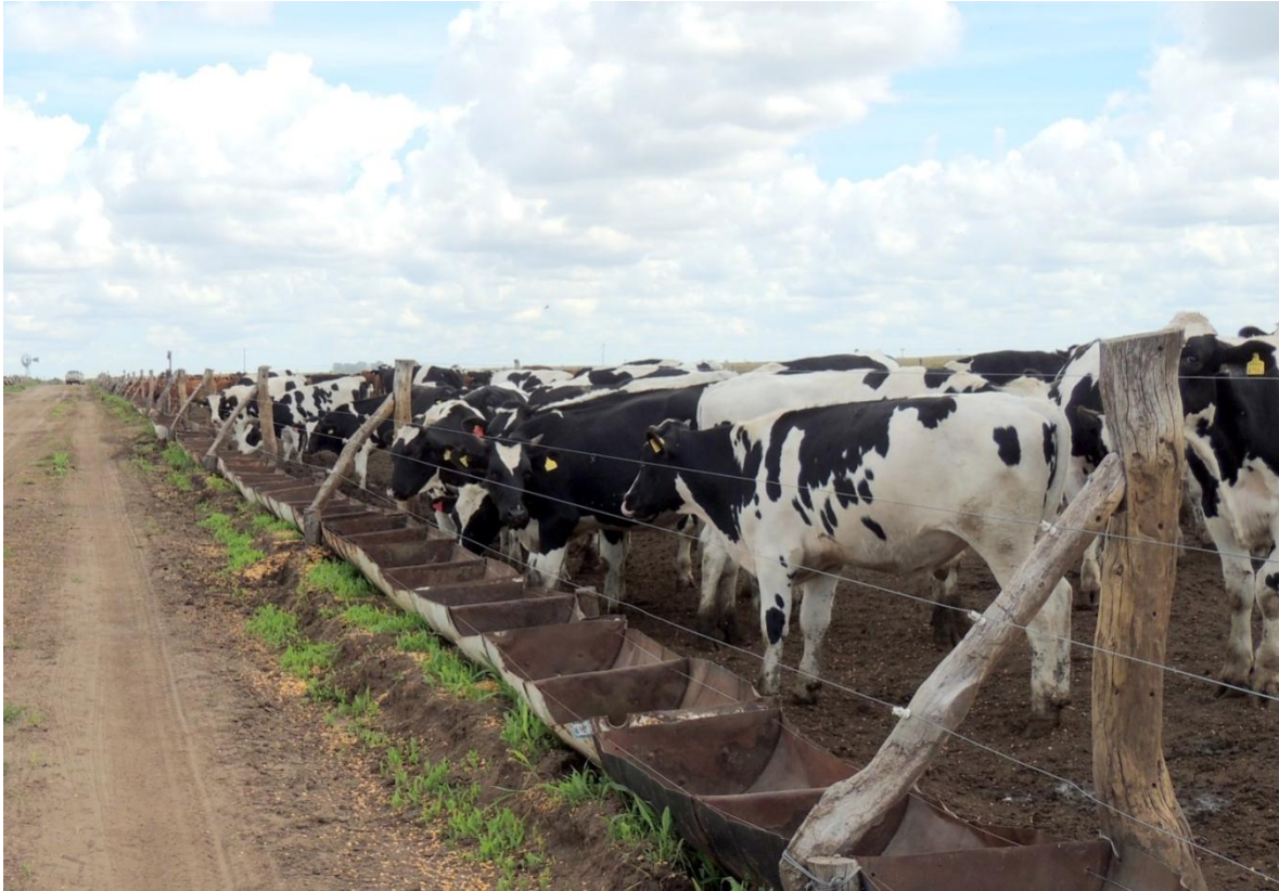
Foto 2: Encierre Holando en establecimiento “La Luisa” – Quemú Quemú, La Pampa.

MERCOLÁCTEA 2014. Dentro del segmento “Camino del macho Holando” se presentaron los resultados obtenidos en Quemú Quemú junto a otras alternativas de producción de carne con animales de biotipo lechero. También el Área de Producción Animal de la EEA INTA Concepción del Uruguay estuvo presente realizando una muestra dinámica de evaluación por ecografía de las características carniceras de animales Holando vs. biotipo carnicero. El propósito fue mostrar al público asistente, diferencias y similitudes entre una raza carnicera y una lechera. Durante las prácticas se resaltaron las virtudes carniceras del Holando y se analizaron las posibilidades de engordar de manera eficiente a este subproducto del tambo.