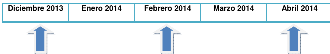
Esquema 1. Momentos de muestreo.

La cantidad total de animales ovinos muestreados (n) de manera aleatoria, durante el período en estudio, fue de 600 (seiscientos).